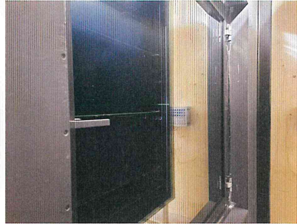
단열성 - 고온실측 사진