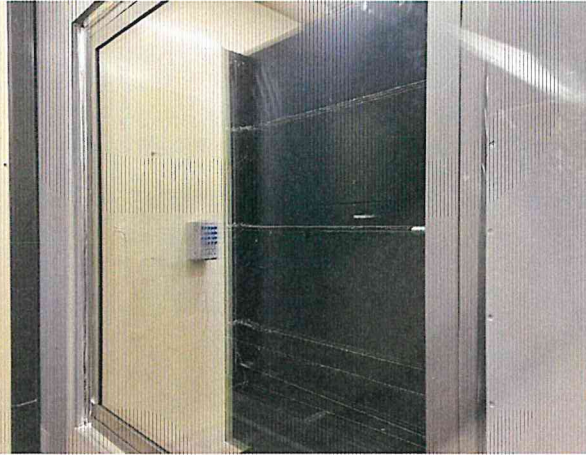
단열성 - 저온실측 사진