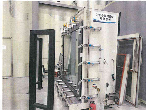
기밀성 - 측면 사진