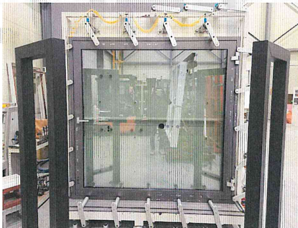
기밀성 - 정면 사진